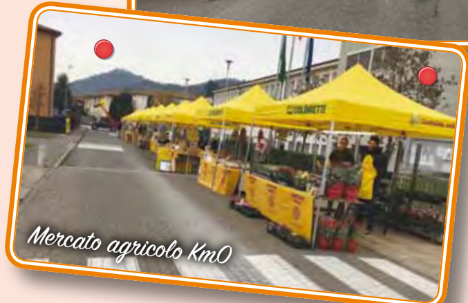
Mercato agricolo Km0