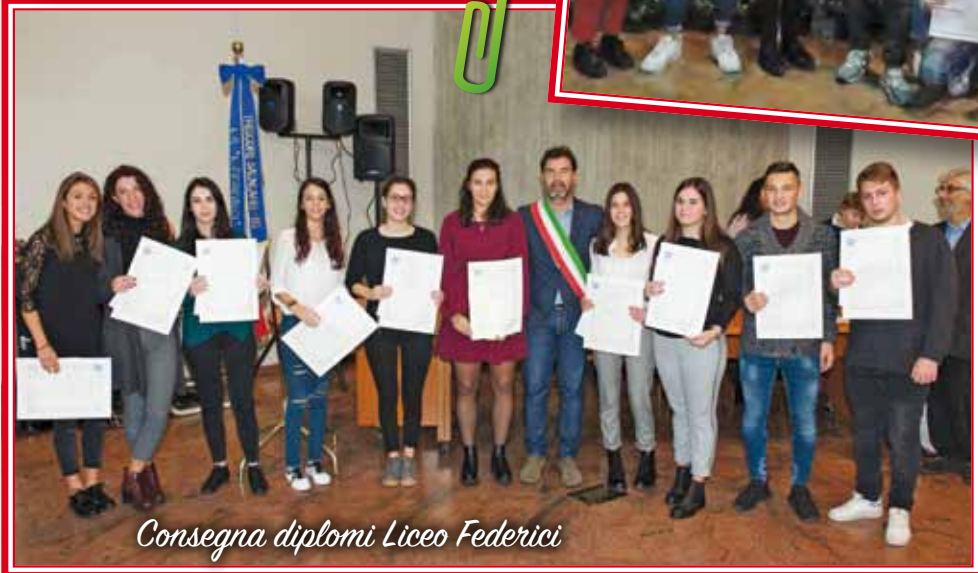
Consegna diplomi Liceo Federici