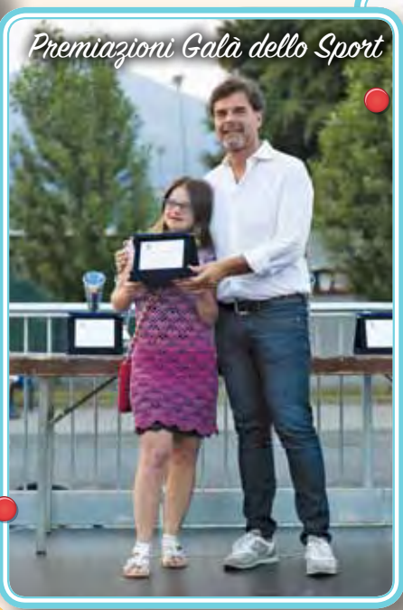
Premiazioni Galà dello Sport