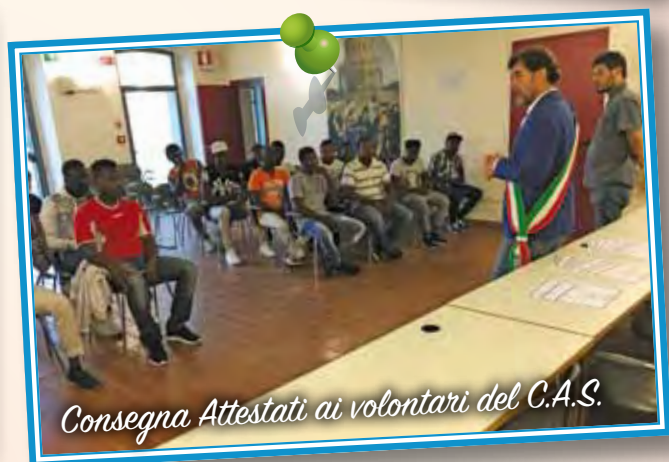
Consegna Attestati ai volontari del C.A.S.