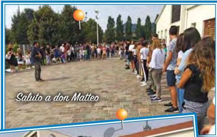
Saluto a don Matteo