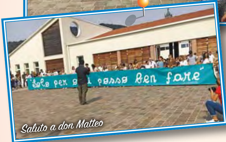
Saluto a don Matteo