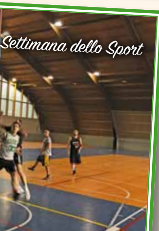
Settimana dello Sport