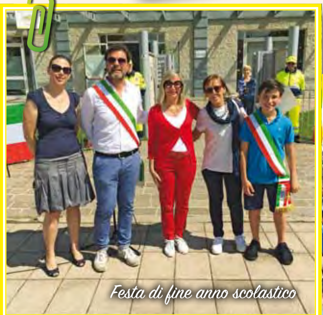
Festa di fine anno scolastico