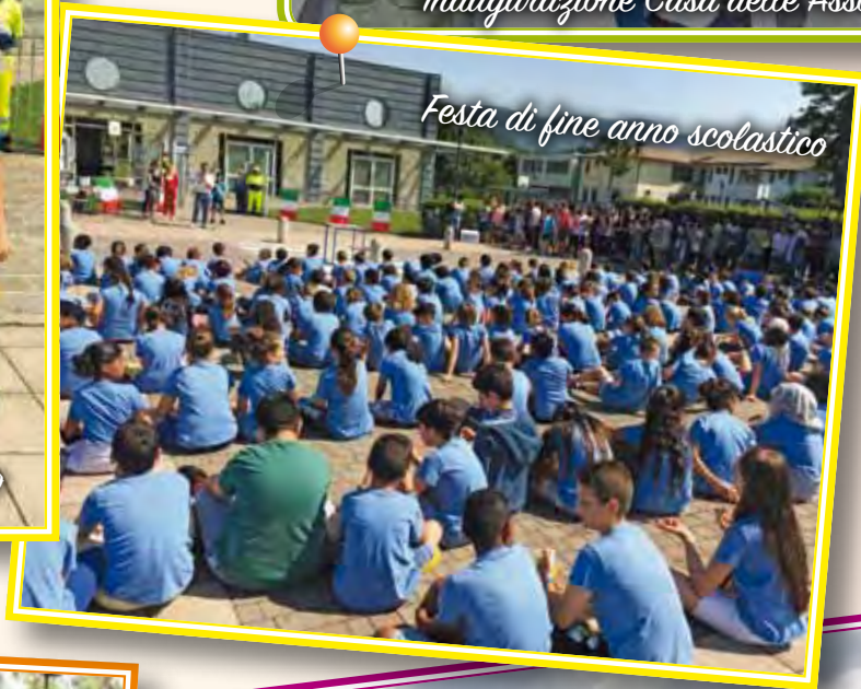
Festa di fine anno scolastico