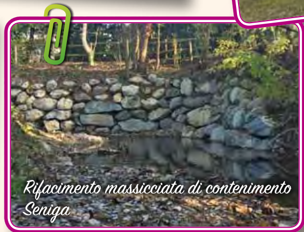
Rifacimento massciata di contenimento Seniga