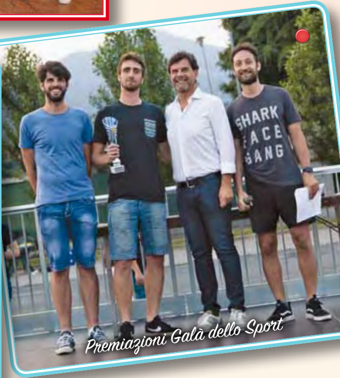
Premiazioni Galà dello Sport