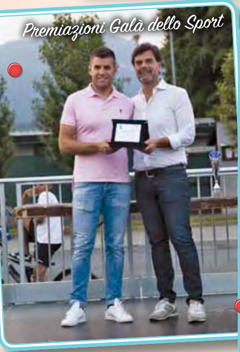
Premiazioni Galà dello Sport