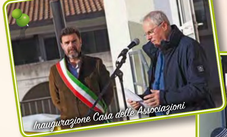
Inaugurazione Casa delle Associazioni