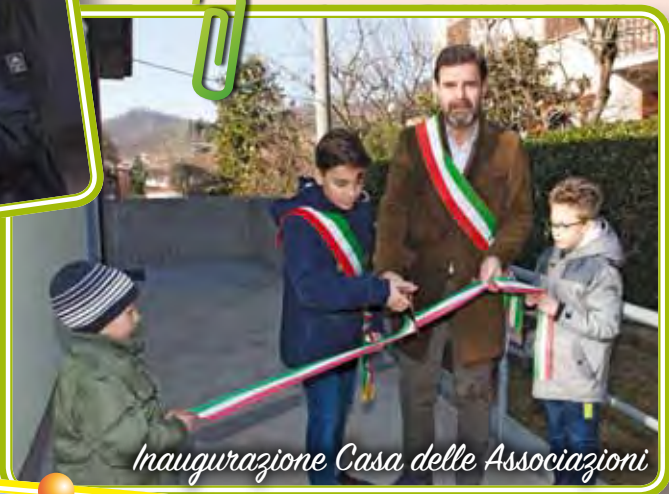
Inaugurazione Casa delle Associazioni