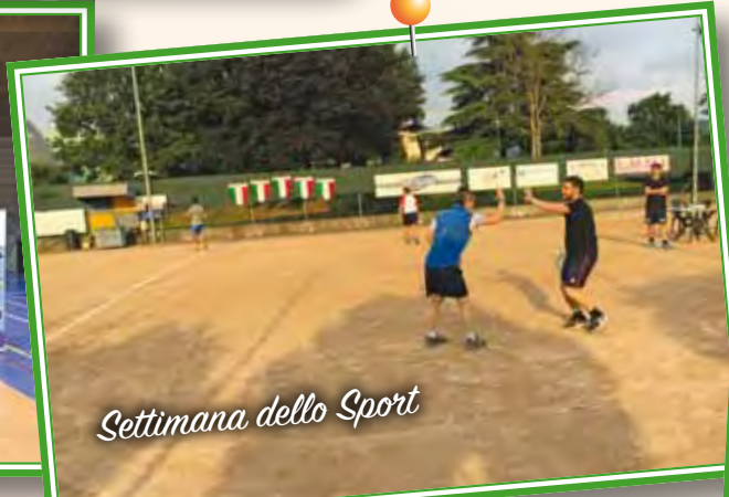
Settimana dello Sport