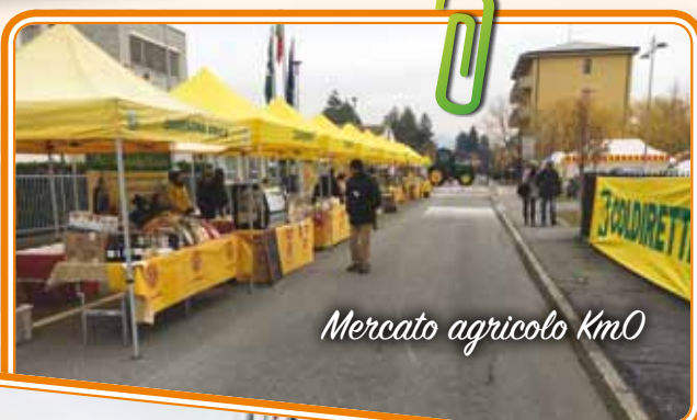
Mercato agricolo Km0