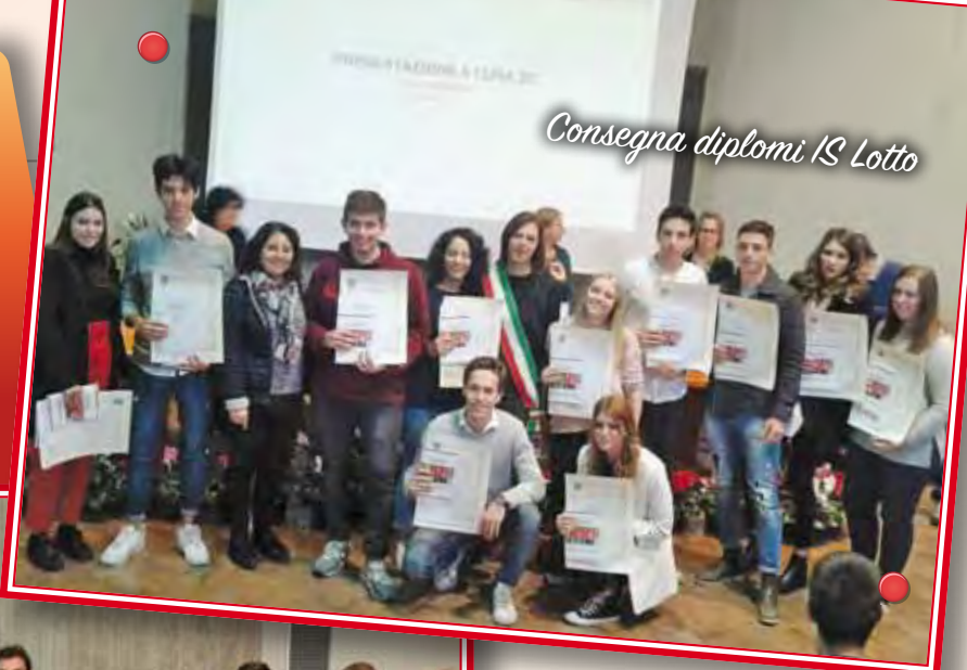
Consegna diplomi IS Lotto