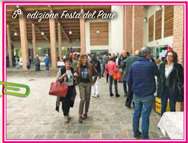
5ª edizione Festa del Pane