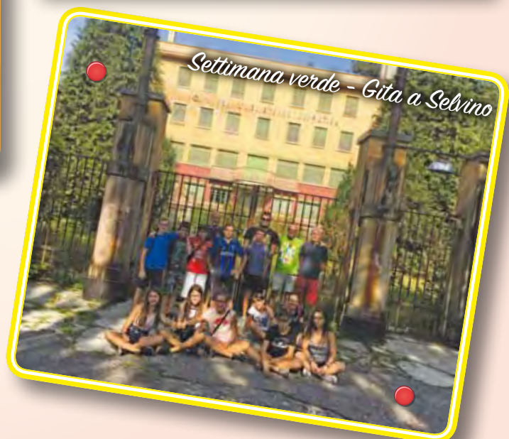
Settimana verde - Gita a Sebino