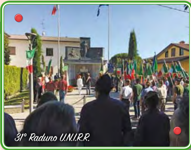
31° Raduno U.N.I.R.R.