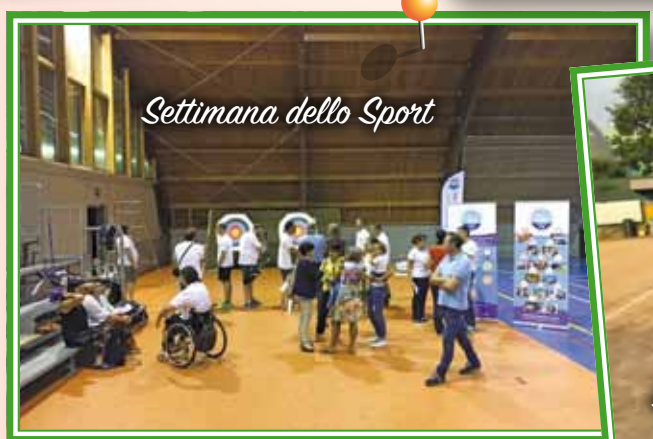
Settimana dello Sport