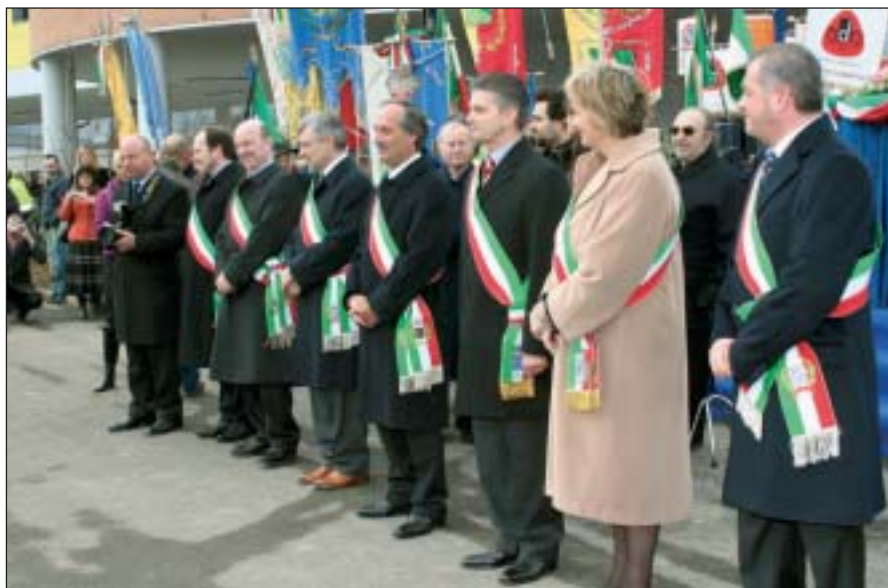
I Sindaci dei sette Comuni che hanno costituito il Consorzio di Polizia Intercomunale durante la cerimonia inaugurale dello scorso anno

Questa è una parte del consuntivo dell'attività svolta dal Consorzio di Polizia Intercomunale dei Colli, al quale San Paolo d'Argon aderisce come socio fondatore dal 2000, l'organismo voluto dalle ammi-