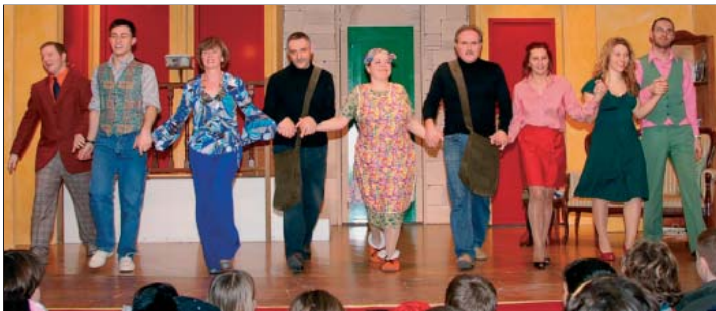
Gli attori della Compagnia «Francesco Barcella» ringraziano fra gli appalusi del pubblico al termine dello spettacolo teatrale