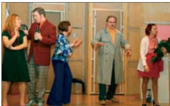
Due momenti della commedia «Rumori fuori scena»

svelo ma consiglio di andare a vedere, con un ritmo ancor più incalzante.