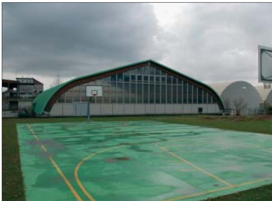
L'area, a destra del campo di pallacanestro, sulla quale sta per essere costruito il nuovo spogliatoio che sarà collegato direttamente con il Palazzetto. Sotto l'ingresso del Campo sportivo comunale di via Colleoni

L'edificio sarà allestito in zona nord, cioè nelle adiacenze del campo di pallacanestro e sarà collegato direttamente con il Palazzetto. I lavori sono già avviati