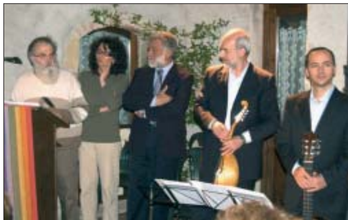
Alcuni momenti delle serate di meditazione all'Eremo di Argon

tecepe costituito, mediamente, da un centinaio di persone, parecchie delle quali giunte dalle vallate bergamasche e dalla pianura, (purtroppo le condizioni atmo-