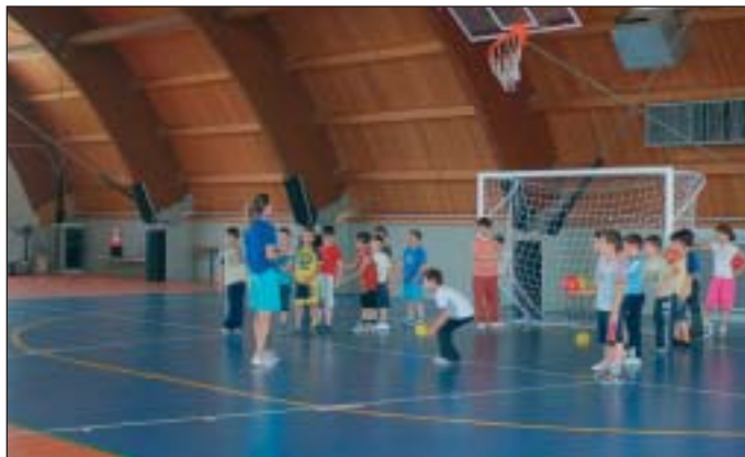
I ragazzi impegnati al Centro Sportivo comunale di via Colleoni

zando le strutture del Centro Sportivo Comunale. «Girogiocando», invece, organizzato dalla Scuola dell'infanzia si è concluso a metà luglio ed è stato frequentato da un'ottantina di bambini in età compresa fra i tre ed i sei anni che, dalle ore 9 alle 16.30, con l'assistenza di dieci fra insegnanti e animatori, hanno preso parte a giochi, laboratori di manualità, passeggiate e momenti di canto. C'era anche la possibilità di un'estensione di orario (7.30 - 18.00) per i genitori che lavorano. Il programma includeva anche una gita a Minitalia.