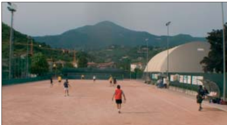
Il campo di tamburello di San Paolo d'Argon al Centro sportivo comunale