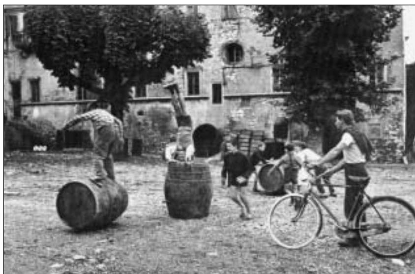
Giochi di ragazzi davanti al Cantinone (anni Sessanta)