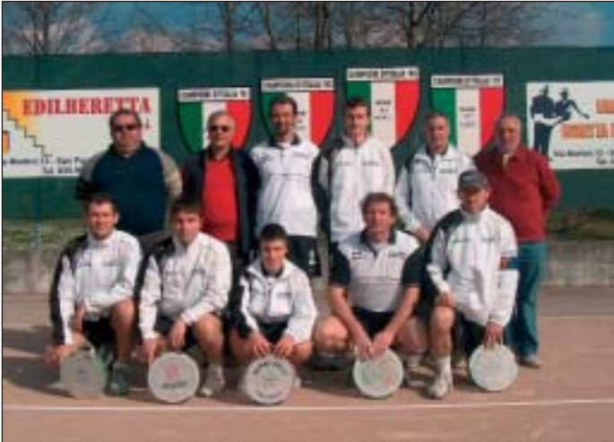
La squadra che ha disputato il campionato di Serie B 2008