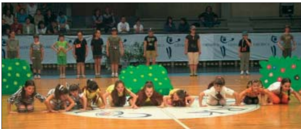
Due momenti del saggio delle allieve di San Paolo d'Argon dei corsi di Ginnastica ritmica svoltosi al Palazzetto dello Sport di Bergamo. In alto il gruppo della «piccole», qui sopra la squadra delle «grandi». I corsi si sono svolti nella palestra delle scuole elementari da ottobre a maggio

L a gara d'appalto per l'affidamento in concessione del servizio di gestione del Centro sportivo comunale di via Bartolomeo Colleoni, che si è svolta nel mese di giugno scorso, si è conclusa con un «non affidamento» del servizio. Pertanto l'Amministrazione comunale ha indetto una seconda gara d'appalto. Possono partecipare alla gara