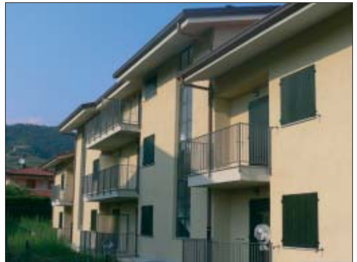
L'edificio di edilizia residenziale pubblica quasi ultimato in via Aldo Moro per un importo complessivo di oltre un milione di euro