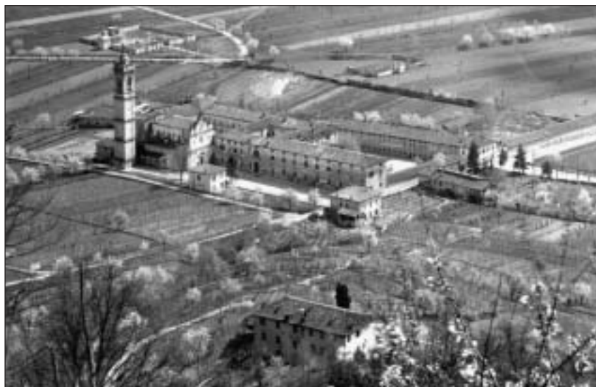
Il monastero e San Paolo d'Argon negli anni Cinquanta

«Chiamarlo "municipio" è una parola grossa. In realtà era un locale nell'edificio che oggi accoglie gli anziani. In quella stanza c'erano l'anagrafe, i servizi di assistenza, l'ufficio tecnico, e c'era un tavolo per il sottoscritto. Il quale, quando doveva ricevere qualcuno e parlare di argomenti personali, se voleva garantire un minimo di riservatezza doveva invitare l'interlocutore ad uscire sul terrazzo, oppure scendere in strada. Di bar non ce n'erano, e si doveva parlare camminando o appoggiati al muro dell'edificio.