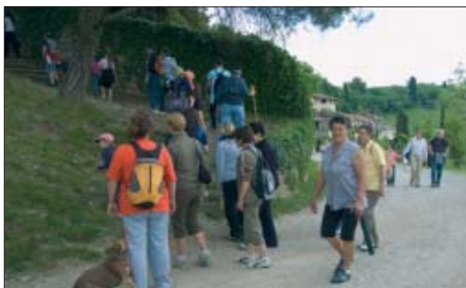
Un gruppo di gittanti ad uno dei tre percorsi programmati

del Vago e la cascina Serbello. Il Seniga, nella sua parte alta, in Comune di Cenate Sotto, è caratterizzato da una struttura ramificata che nasce da nove sorgenti, a loro volta caratterizzate da piccoli specchi d'acqua che formano un importante biotopo all'interno del territorio agricolo antropizzato.