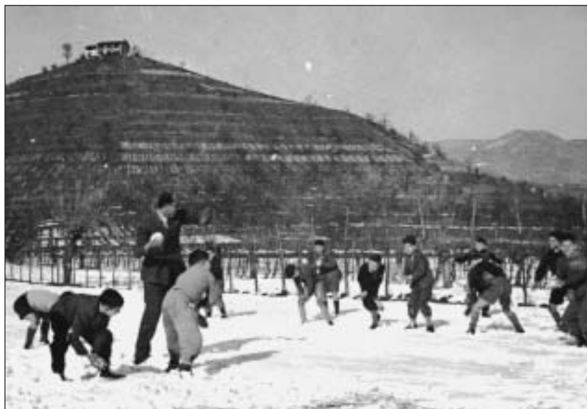
Giochi nella neve ai piedi della collina del «Casocc» (anni Cinquanta)

«Le ho già detto non c'era acqua corrente in casa. Era una situazione che mi pesava sulla coscienza e, anche se in Consiglio comunale l'orientamento era sottovalutato - dicevano che prima dell'acqua era meglio pensare al vino - non potevo lasciare l'incarico senza aver tentato qualche iniziativa per risolvere il problema. Ma che fare? Non dimentichiamo che erano anni in cui non c'erano punti di riferimento professionali, consulenti, aziende specializzate; occorreva affidarsi alla fantasia nella convinzione che forse si sarebbe arrivati ad un risultato positivo. Bisò-