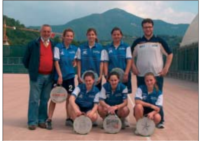
La squadra femminile del campionato di Serie A

La storia del tamburello è antica. Risale ai Romani, ma è nel Rinascimento con la «pallacorda» e la «palla con lo scanno», che si avvicina al tamburello di oggi. Nella tradizione bergamasca questo sport viene ricordato dai più come un gioco di piazza, il cui attrezzo si è evoluto fino ai tamburelli di oggi, costruiti con un telaio in plastica molto resistente, capace di dare impulsi e far correre fino alla velocità di 250 Km/h, una pallina in gomma di 82 grammi e con un diametro di 61 millimetri.