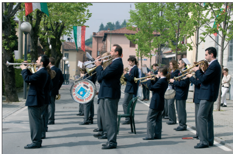
Il Corpo Musicale di San Paolo d'Argon durante una cerimonia pubblica