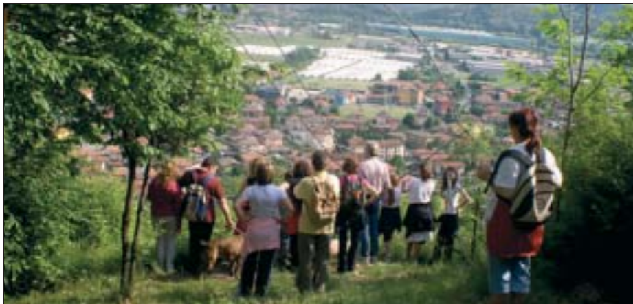
Alcuni momenti della visita fatta a Villa Frizzoni nel maggio scorso

si sono resi protagonisti di non pochi avvenimenti a favore di Bergamo.