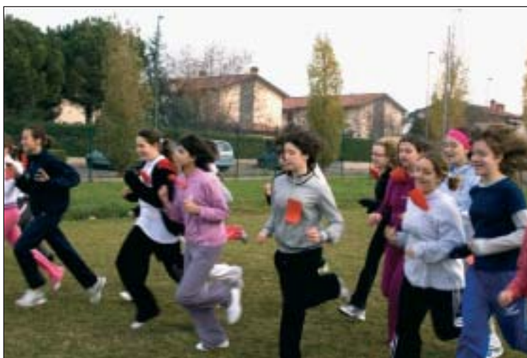
Un gruppo di allieve durante la corsa campestre

della classe frequentata e del sesso. Il percorso di gara, che si snodava a serpentina tra il campo da calcio e quello di basket, variava a seconda della categoria: da 600 metri per gli alunni delle elementari fino a 1200 metri per quelli di seconda e terza media.